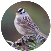
GORRIÓN DE CORONA BLANCA

Gorriónes de corona blanca, Jilgueritos canarios y dominicos, y Pinzones mexicanos