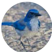
CHARA DE COLLAR