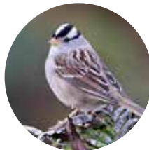
GORRIÓN DE CORONA BLANCA